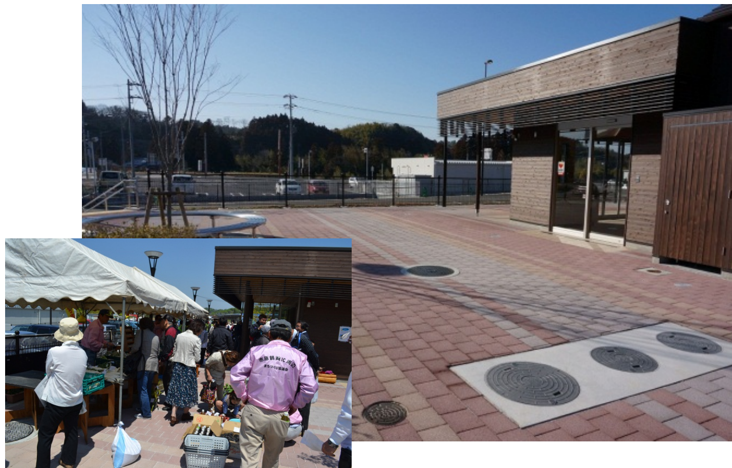
産地直売会の様子