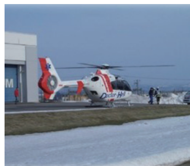
ドクターヘリの常時受入れや、スカイパトロールを行う航空防災活動

航空機材を活用し、地域に根ざした積極的なまちづくり活動を実施することにより、たきかわスカイパークには年間3万人が訪れるなど大空に一番近い場所として地域住民に親しまれています。