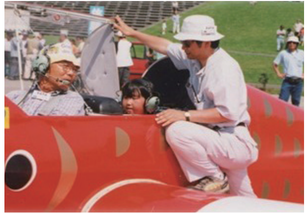
地域住民に大空の夢を育ませる市民体験飛行会