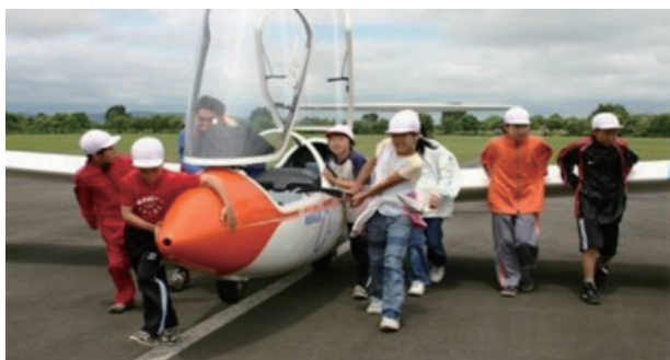
「総合的な学習の時間」を活用した小学生のグライダー体験授業。自分のまちを「鳥の目」で眺め、新たな視点で学習に活かします

また、ドクターヘリの常時受入れや、消防、警察、近隣自治体と協定を締結し、日常の飛行活動の中で