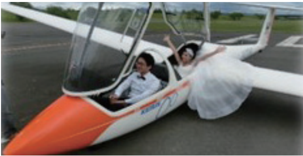
東アジア観光客のフォトウェディング

特にグライダーの観光活用事業においては、観光体験飛行が大きく伸び、東アジア観光客をターゲットとしたフォトウェディングなどのツアーを実施しており、今後も海外観光客の誘致には需要の拡大が見込まれます。