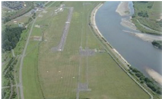
広大な石狩川河川敷に広がる、日本でただ一つの本格的な航空公園。いつでも誰もが自由に空と触れ合える「空の波打ち際」

たきかわスカイパークは、昭和56年の集中豪雨による洪水被害状況を当時の市長が空から視察したことをきっかけに、青少年に大空の夢を与えるという社会教育的見地から、平成5年、グライダーの離発着に必要な広大な敷地と上昇気流が得やすい地形・気象条件に恵まれた滝川市の石狩川河川敷地に