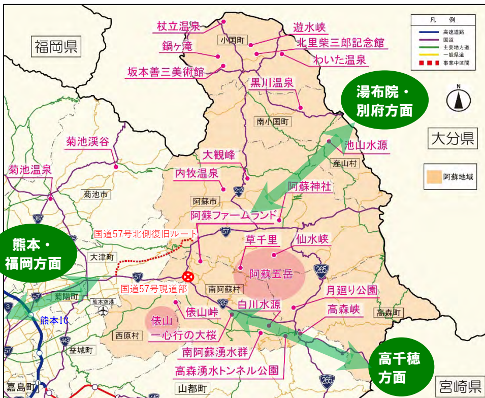
▲ 阿蘇地域における主な観光施設