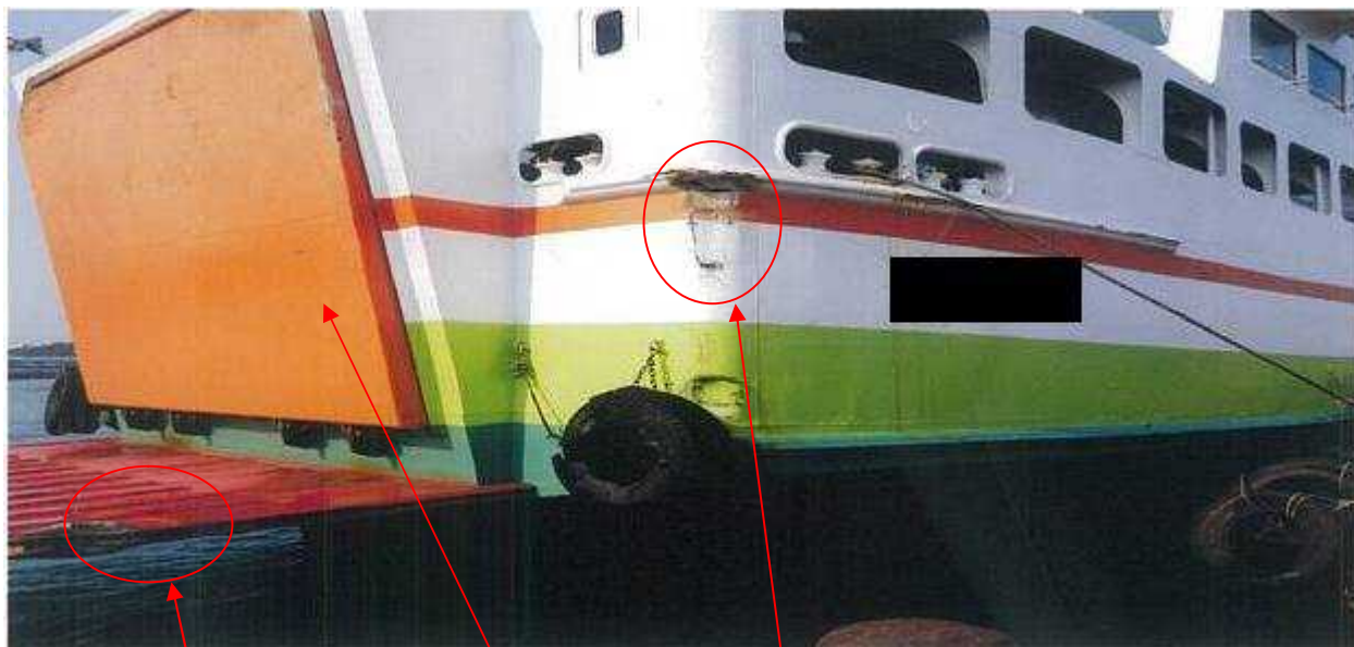
船首エプロン部の損傷 ランプゲート 左舷船首部の損傷