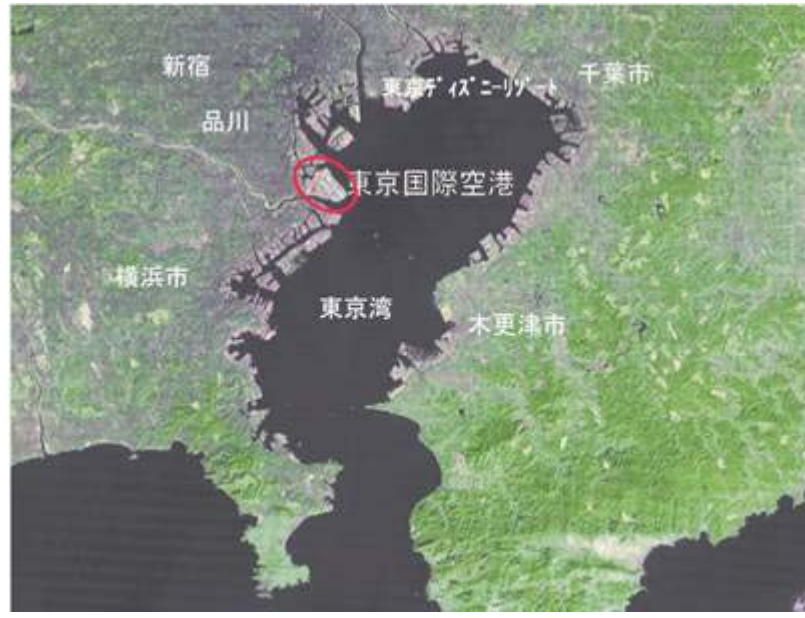
図一1 東京国際空港位置図