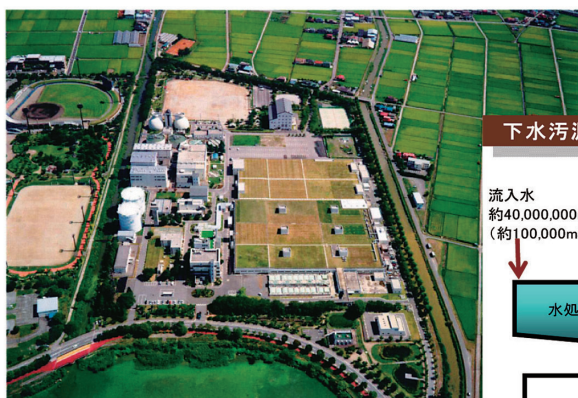
豊田終末処理場（クリーンレイク諏訪）