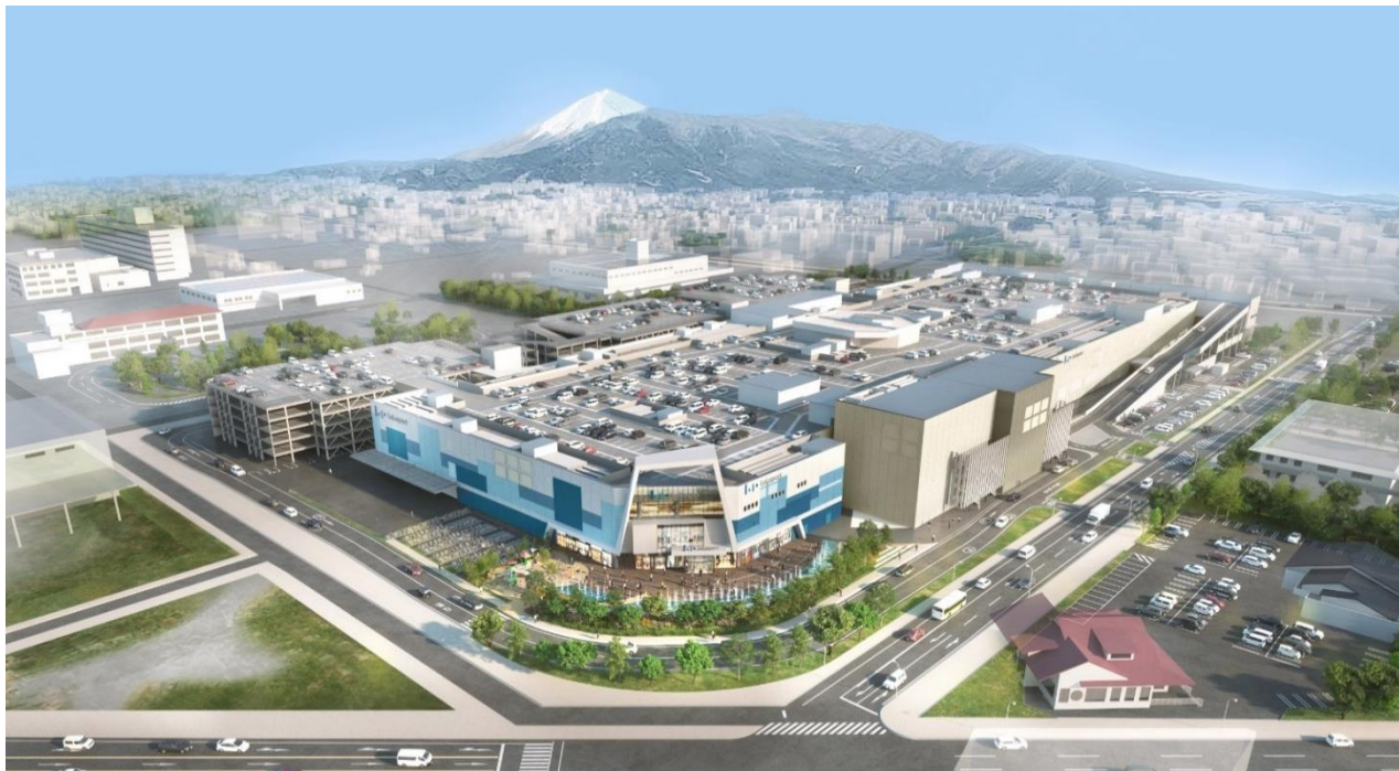
「(仮称) 三井ショッピングパークららぽーと沼津」建物全体イメージ