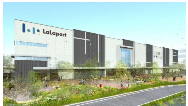
北側外観イメージ

デザインコンセプトは“Meet Urban Meet Nature”とし、洗練された都会の高揚感と豊かな自然がもたらす安心感に包まれた新たな施設(空間)が誕生します。外観には、施設の背後にそびえる富士山を思わせるキャノピーを採用、色彩計画は、アクセントカラーを配し、施設の視認性および認知度を高め、お客様の記憶に残るデザインとします。モール内部も建物やランドスケープ(外構)との調和を意識し、賑わいやワクワク感に加え、いつも来たくなるような快適な空間をデザインします。