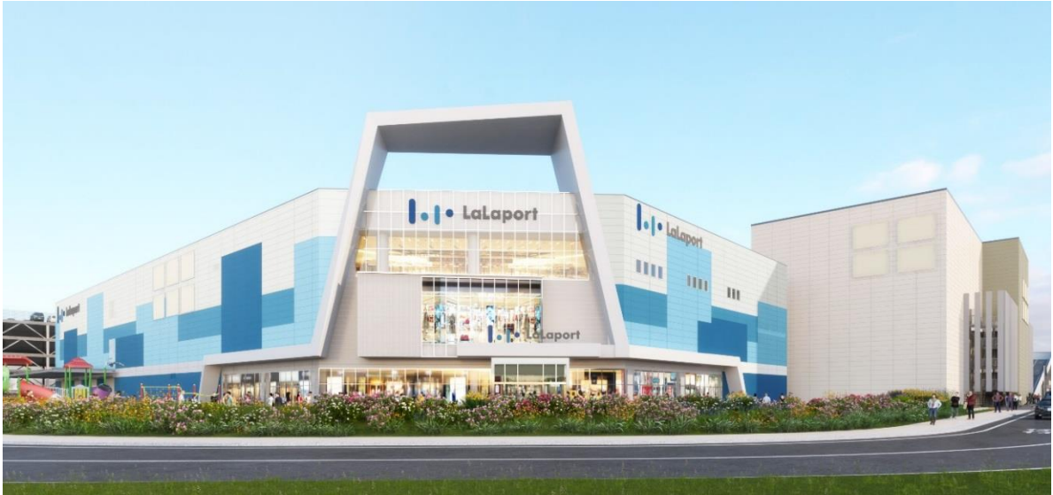
「(仮称)三井ショッピングパークららぽーと沼津」南側外観イメージ