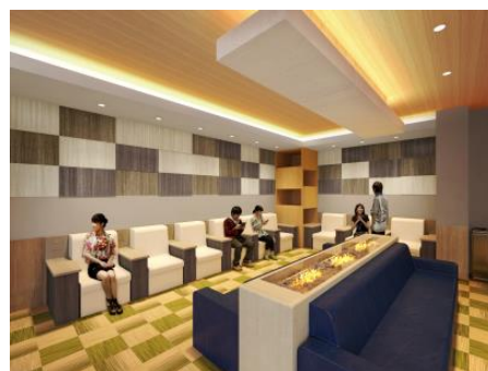
ラウンジスペース(イメージ)

今回、第5期増床棟に、お客様に快適にショッピングをお楽しみいただけるよう、各席に充電用のコンセントを備えたラウンジスペースを新設します。ショッピングの合間や待ち合わせ時間にゆったりくつろいでいただける上質な空間を提供いたします。