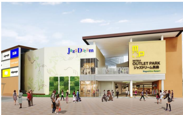
第5期増床棟 南エントランス(イメージ)