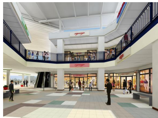
第5期増床棟 南側広場(イメージ)

三井不動産株式会社は現在、「三井アウトレットパーク」を国内で13施設、海外で3施設のアウトレットモールを運営しております。今後も既存施設の魅力向上を目指し、各種施策に取り組んでまいります。