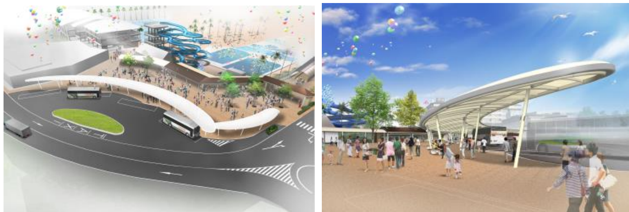
バスターミナル(イメージ)

今回の開発により、当施設南端とバスターミナル、ナガシマリゾートの西ゲートがつながることとなり、ナガシマリゾート全体の回遊性がさらに向上します。加えてバスターミナルの刷新を行うことで、より一層魅力的なエリアとなります。