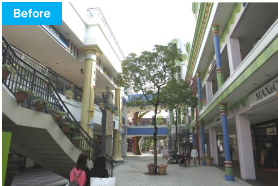
リニューアル前の既存棟外観