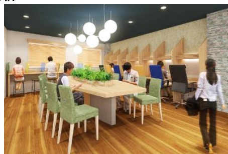
従業員休憩スペース(イメージ)

お客様にベストサービスを提供するため、ES（従業員満足）向上を目指し、今回従業員向けの休憩スペースも刷新いたします。環境デザイナーのアドバイスを活かした空間演出や、歯磨きスペース・パウダーコーナーの設置など、第5期増床棟・既存棟の休憩スペースともに刷新いたします。