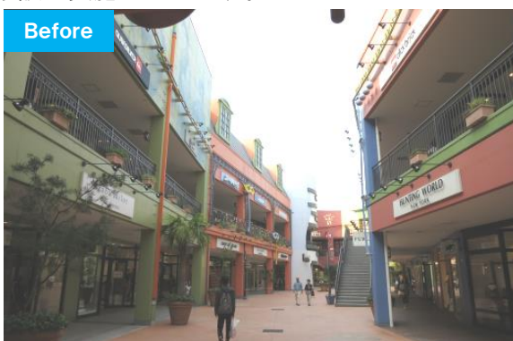
リニューアル前の既存棟外観

今回の大規模リニューアルでは、従来からのデザインコンセプトは踏襲しつつも、洗練された上品で高級感のあるデザインに刷新。壁面デザインやオブジェの変更を行なうことで、第5期棟も含め、全館のデザインに統一感をもたせます。また、日本一の店舗数となるブランドラインナップをお客様に快適に楽しんでいただけるよう、既存棟を中心に施設全体の動線を見直し、階段・エスカレーターなどの増設も実施いたします。