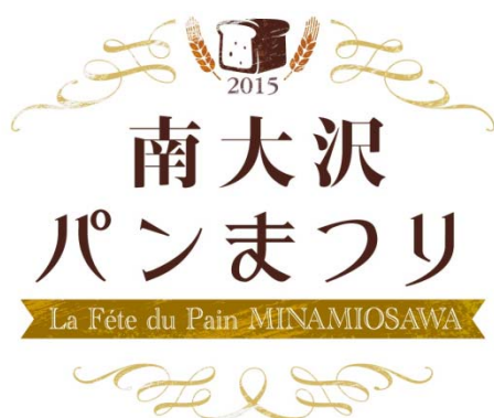
「南大沢パンまつり」ロゴ

リニューアルを記念し、10月30日(金)から一部先行リニューアルセールを開催します。11月13日(金)からはリニューアルグランドオープンセールを開催します。また、地元の「元気な街」南大沢協力の会と連携し、有名パン屋約50店舗が集結する「南大沢パンまつり」を、一部先行リニューアルオープンに合わせて11月1日(日)から11月3日(火・祝)まで開催します。また、その他各種イベントを新設された「フェスティバルステージ」において開催します。