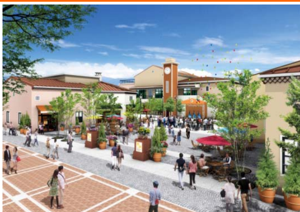
「フェスティバルステージ」イメージ（B街区）