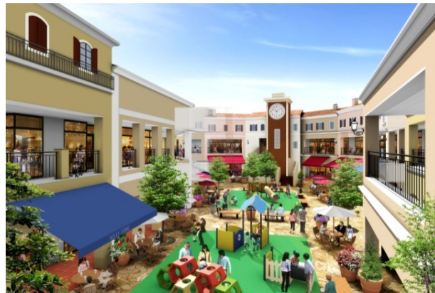
「ギャザリングコート」イメージ (A 街区)

また、開業以来、施設の特徴である南仏プロヴァンスの街並みをモチーフにした外壁面の改装など施設設備もリニューアルし、新しく生まれ変わった施設となります。