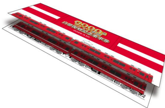
記念乗車券 台紙イメージ