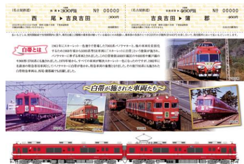
記念乗車券 イメージ(台紙内側・券面)