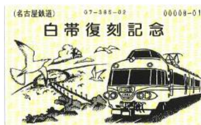
白帯復刻記念券イメージ