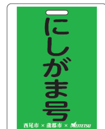
イラスト系統板イメージ