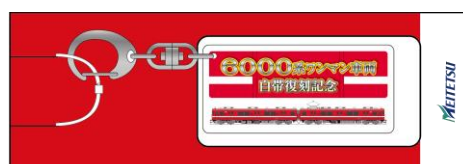
記念キーホルダーイメージ