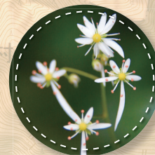
8月:ダイヤモンドソウ