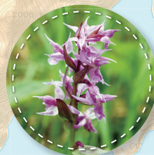
7月:ハクサンチドリ