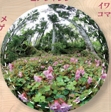
7月:イワカガミ大群落