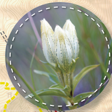
8月:トウヤクリンドウ