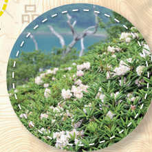
7月:ハクサンジャクナゲ