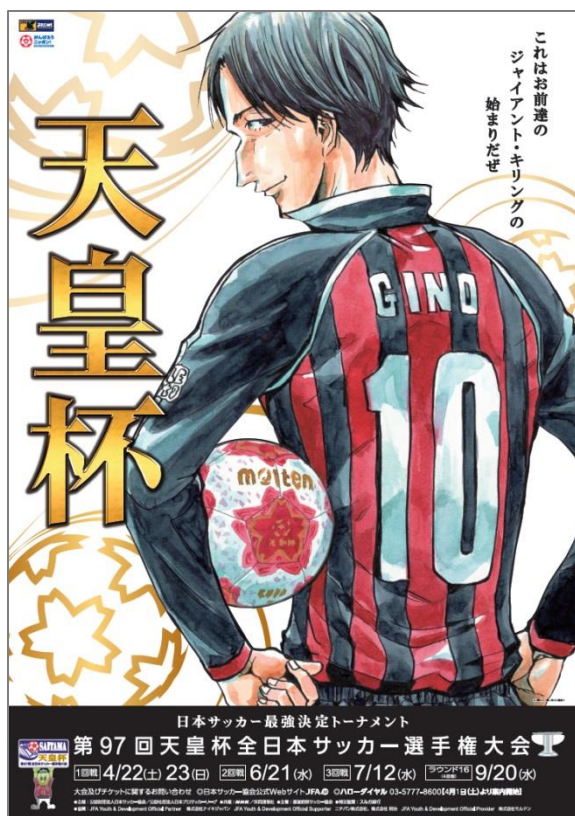
GIANT KILLING / 講談社