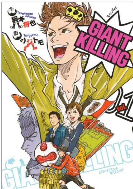
GIANT KILLING