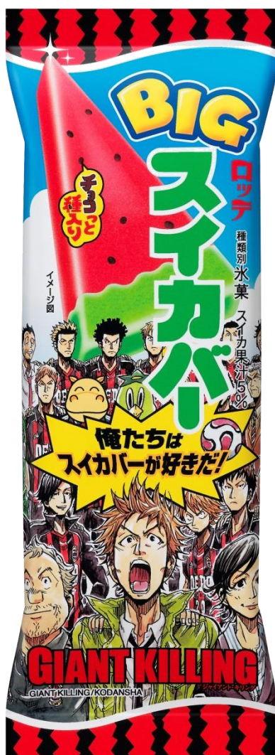
GIANT KILLING / 講談社