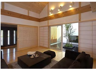
パッシブデザインの高気密高断熱住宅

高性能断熱材で家を全体的にすっぽり包み込む「外張り断熱工法」、高性能換気システム、断熱性に優れたサッシの採用により、大空間でも、夏涼しく冬あたたかい室内環境を少ない光熱費で実現。吹き抜けなどの開放的な間取りを現実のものにしやすくなります。同時に、パッシブデザインとよばれる設計手法を用い、自然の光と風を上手く採り入れ、四季を愛で、自然と共生する心地の良い暮らしも実現します。