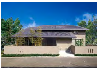
街並みにとけこむ和モダンデザイン

一邸一邸、家族の理想をカタチにする自由設計の家づくり。外観デザインは、住まい手の満足を追求すると同時に、社会資本の一部と考え、街並みへ調和することが大切だと考えています。このため、日本家屋のもつ伝統的な造形美と普遍性を未来へと受け継ぐ「和モダン」デザインを中心に提案。室内は、木曾ひのきの美しい木目と色合い、自然素材を活かしながら、ひのきが香り長く愛される癒しのインテリアデザインを提案します。