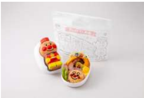
▲アンパンマン弁当 ¥1,250(税込)

会場内の臨時売店にてアンパンマン列車関連グッズを販売します。通常は四国に行かないと購入できない水筒付きの「アンパンマン弁当」と「げんき100ばい!アンパンマン弁当」の2種類(各50個限定)を販売します。その他玩具、雑貨等も販売いたします。