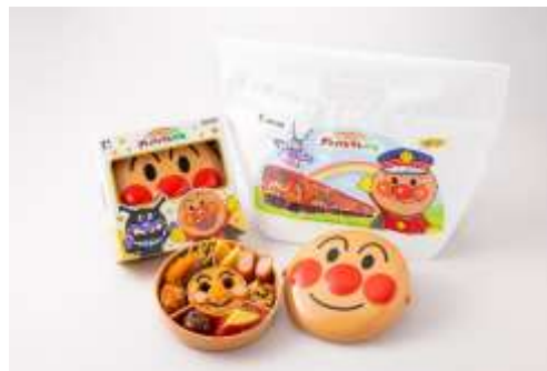
▲げんき100ばい!アンパンマン弁当 ¥1,350(税込)