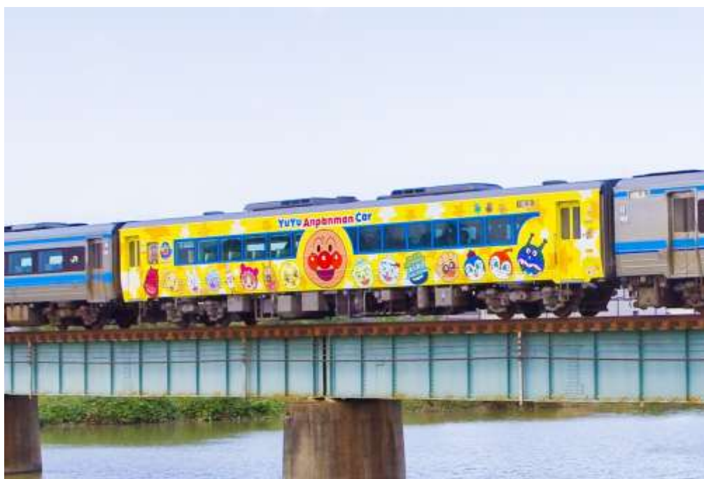
▲ゆうゆうアンパンマンカー