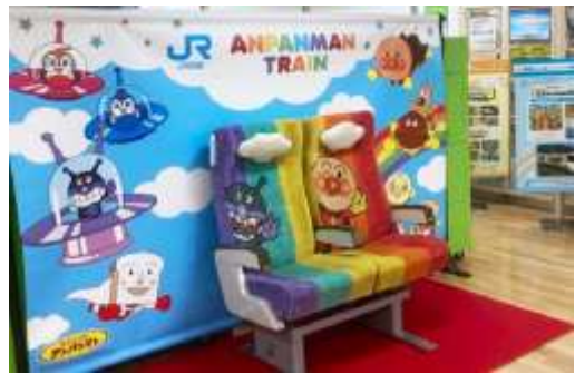
▲イメージ(記念撮影用アンパンマンシート)

車両の前に設置されたステージやアンパンマンシートに座って記念撮影をお楽しみ下さい。