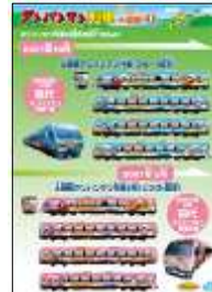
▲パネル展「アンパンマン列車のれきし」