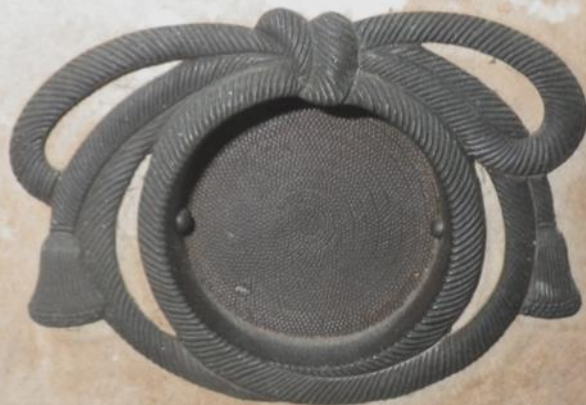
①松琴亭・結紐形引手

しょうきんてい しょういけん げっぽろう 松琴亭、笑意軒や月波楼で工夫を凝らした引手をご覧になることができます。