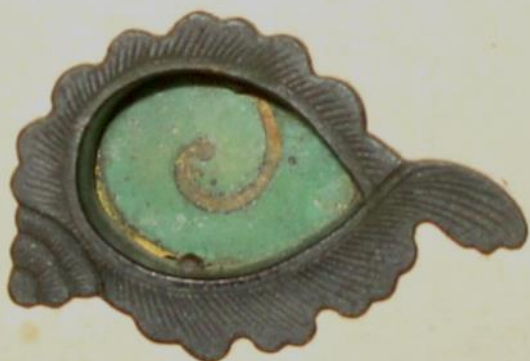
②松琴亭・螺貝形引手

松琴亭には、紐を結んだ形を表した結紐形引手(写真:①)があります。「手掛かり」と呼ばれる手をかける部分を袋に見立て、巾着袋を模しているといわれています。巾着袋には宝物を入れることから「宝尽し」文様の一つに挙げられています。他には螺貝形引手(写真:②)があり、こちらは法螺貝を表しているといわれています。法螺貝等の貝は中国では八宝の一つで吉祥文様として扱われ、日本には「宝尽し」文様の一つとして伝わったとされています。