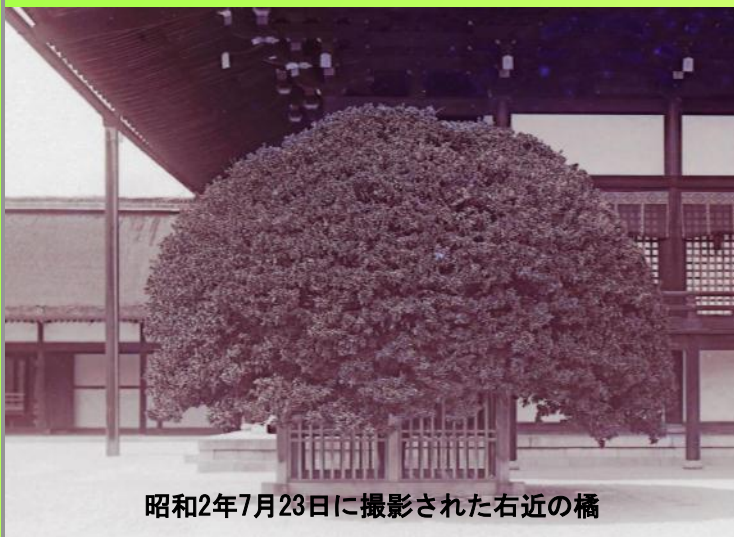
昭和2年7月23日に撮影された右近の橘

樹齢が170年以上を経過しているため、やや弱ってきているので、花が咲き実をつけると木に負担がかかるため、できるだけ花を摘み取っています。