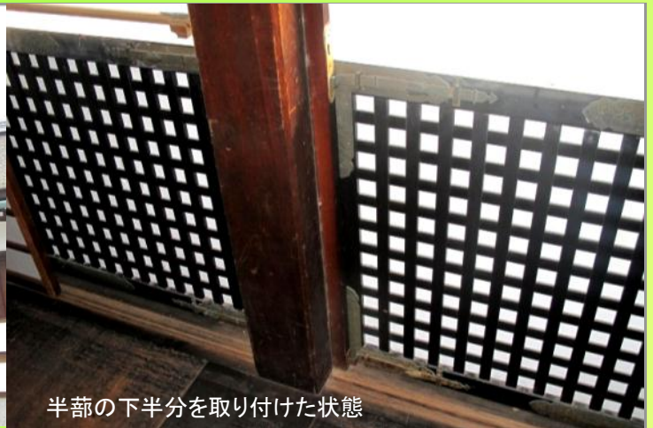
半蔀の下半分を取り付けた状態

半蔀(写真:②)とは、上半分は蔀戸と同様の仕様となっておりますが、下半分は取り外しが可能な柱にはめ込み式の蔀がはめられているものを言います。京都御所では小御所や御常御殿の南側で見ることができます。