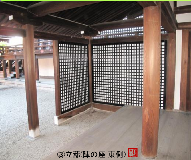
③立蔀(陣の座 東側) 殿

半蔀(写真:②)とは、上半分は蔀戸と同様の仕様となっておりますが、下半分は取り外しが可能な柱にはめ込み式の蔀がはめられているものを言います。京都御所では小御所や御常御殿の南側で見ることができます。