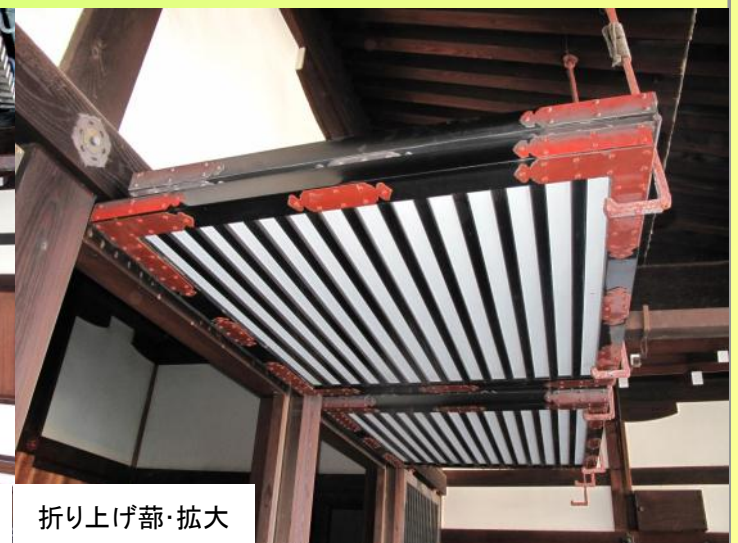
折り上げ蔀・拡大

折り上げ蔀(写真:④)とは、上に跳ね上げる部分の中央が折り曲げられるようになっている蔀のことで、折り曲げた後に外側に跳ね上げて吊り金物で固定するという少し違った形状をしています。京都御所では清涼殿北側滝口付近で閉まった状態ですが、見ることができます。