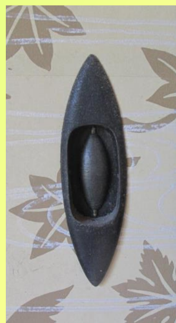
④月波楼・杼形引手

この他にも、御殿には様々な意匠の引手金物があり、現在は桂離宮参観者休所にてその一部を展示しています。