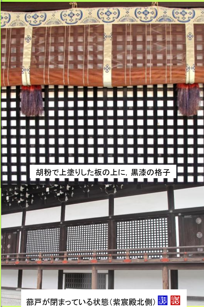
胡粉で上塗りした板の上に、黒漆の格子