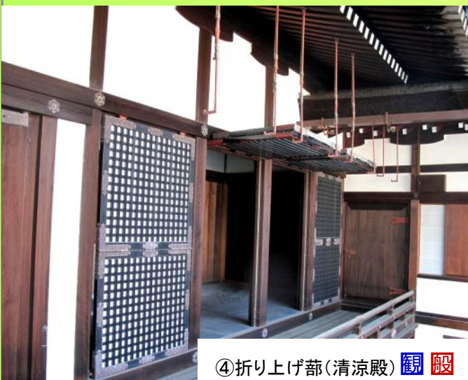
④折り上げ蔀(清涼殿) 観殿

立蔀(写真:③)とは、庭上などに目隠し用として設けられた、はめ込み式のものを言います。京都御所では紫宸殿東側の陣の座(近衛府の官人が陣を設けたところ)や清涼殿の南側などにあります。