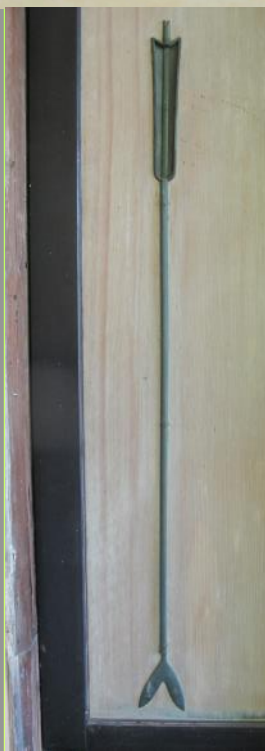
③笑意軒・矢形引手

松琴亭には、紐を結んだ形を表した結紐形引手(写真:①)があります。「手掛かり」と呼ばれる手をかける部分を袋に見立て、巾着袋を模しているといわれています。巾着袋には宝物を入れることから「宝尽し」文様の一つに挙げられています。他には螺貝形引手(写真:②)があり、こちらは法螺貝を表しているといわれています。法螺貝等の貝は中国では八宝の一つで吉祥文様として扱われ、日本には「宝尽し」文様の一つとして伝わったとされています。