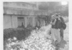
マンションのよう壁からの湧水を見つめています。