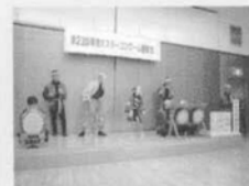
柳窪に伝わっているお囃子 の演舞