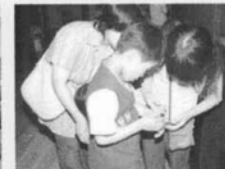
子供たちに大人気だった ホタル鑑賞会

本紙「里川 (Vol. 30)」においても、一斉調査当日の様子をお伝えしましたが、上のレポートからも当日の様子が再認識できたのではないのでしょうか？ 次回の一斉調査は平成18年6月4日(日)を予定しています。詳細は4月以降の本紙においても案内しますので、皆さん奮ってご参加下さい。