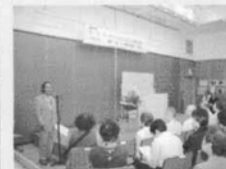
日曜日に開かれた講演会 の様子