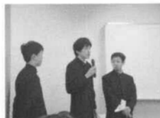
明法学院中学・高等学校 科学部の発表