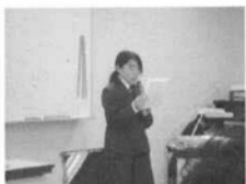
志木市立宗岡中学校 科学部の発表