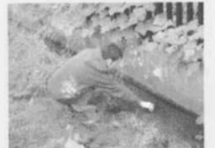
はんの木緑地裏の水路で湧水を探取しています。

風もなく暖かな好天の中、午前10時に光が丘公園の出入口に近い牛房バス停前に集合、まずは歩いてすぐ(旭町二丁目11番地)の谷戸に向かいました。ここは、光が丘公園の一角、木々に囲まれた谷間を下ったところの湧水を指しますが、当日の湧水量はほんのわずかでした。次に「はんの木緑地」の湧水に向かいました。こちらは民有地の崖下から湧いているものでかなりの量がありましたが、泥の積もった水路の底から湧いていて測定できる状況ではありませんでした。しかしその水路には小さな流れが生まれていて、少し下ったところにはアメリカザリガニが生息していました。少ないながらもこれらの湧水が白子川に注いでいることを再確認しました。その後は白子川沿いに出て右岸の湧水ポイントを確認しました。白子一丁目の民有地倉庫の裏手から湧水が注ぐのを見た後、白子二丁目の湧水ポイント5箇所を見てまわりました。これらの湧水はいずれも一定の水量を保っているようでした。