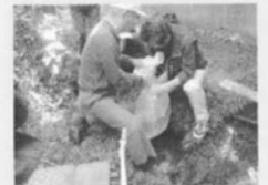
湧水量の測定に、ここではビニール袋を用いました。