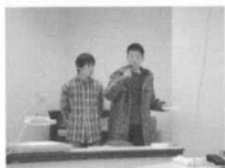
埼玉県立いずみ高等学校 釣り愛好会の発表