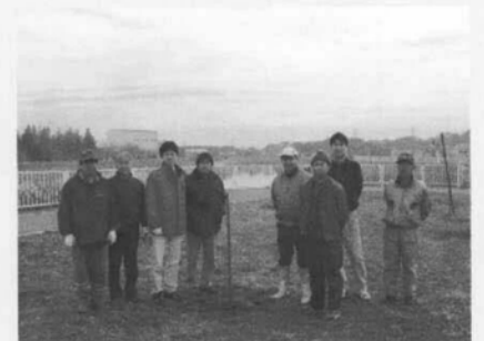
植樹後の記念撮影です。皆さんお疲れ様でした。