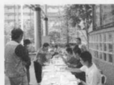
市役所のロビーで行われた 水質調査の様子

また、環境フェスティバルの会場では、東京都から「黒目川の河川整備計画(案)」が公開され、市民からの意見公募がありました。東久留米市でも市民と行政との話し合いを進めて、市長名で同案に対する意見書を提出しました。