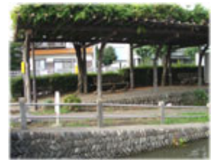
用水路脇の休憩所

江戸時代から農業用水として利用されてきた大丸用水は現在でも梨園や水田に水を供給しています。昭和30年代後半からの急激な宅地化（多摩ニュータウン計画、等）や戦後にできた米軍立川基地の廃油の放流などにより、多摩川と用水の水質は著しく低下しましたが、下水道の普及により美しい用水を取り戻し、一時は減ってしまった小魚や藻も戻ってきました。