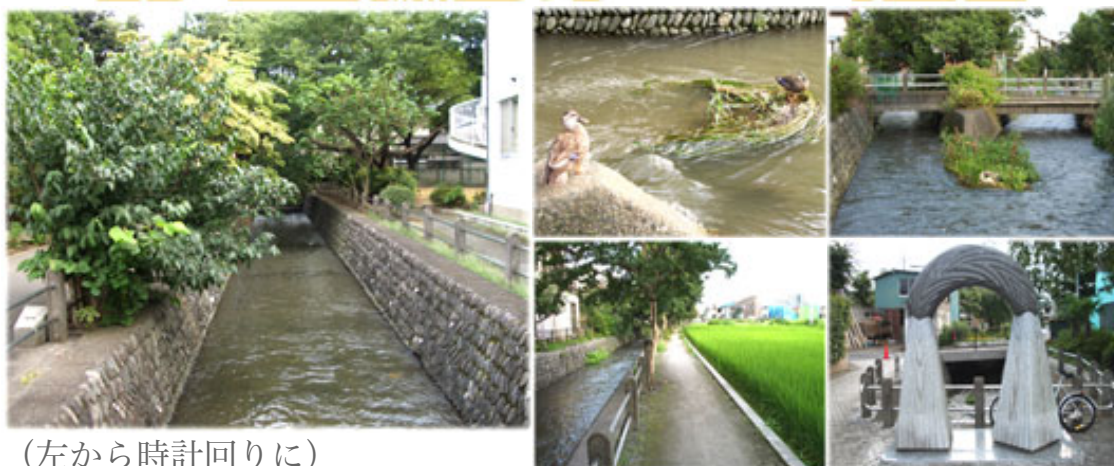
(左から時計回りに)

遊歩道脇の用水路／分水路で憩うカルガモ／菅堀（左側）と押立堀の分岐路／水田脇の用水路／親水公園入口（写真-H20.8撮影）