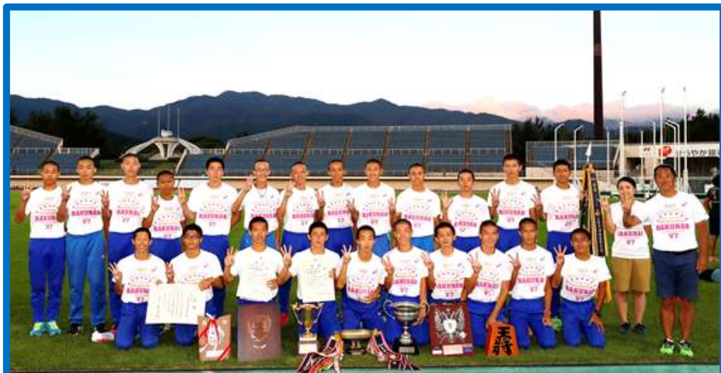
男子総合優勝 洛南高等学校（京都）3年連続7回目