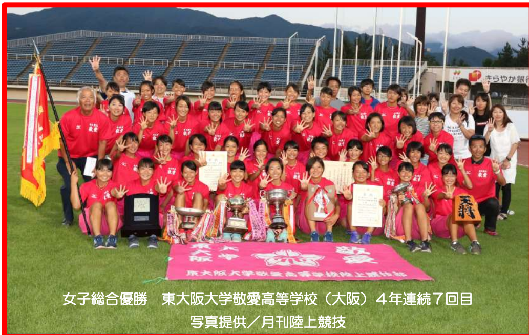
女子総合優勝 東大阪大学敬愛高等学校（大阪）4年連続7回目