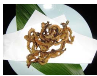
うつぼの唐揚げ (イメージ)