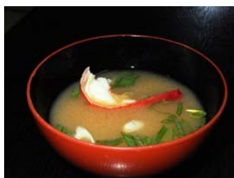
伊勢えび汁 (イメージ)