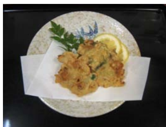
あこや貝貝柱のかき揚げ (イメージ)