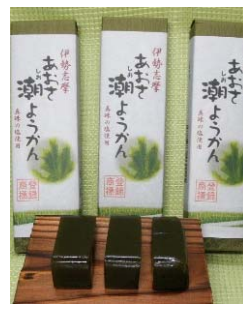
あおさ潮ようかん