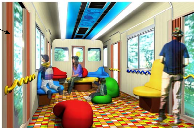
「風のあそびば」 イメージパース