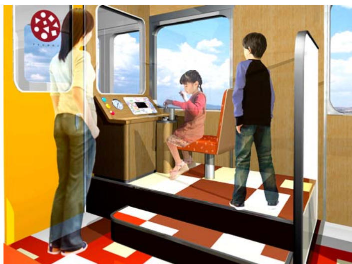
「こども運転台」 イメージパース

運転台を通して前方の景色を見ながら運転操作を楽しみ、運転士気分を味わっていただけます。お子様の運転操作と連動してメーターや表示灯が点灯します。また、子供用の制服を用意しており、記念撮影もしていただけます。