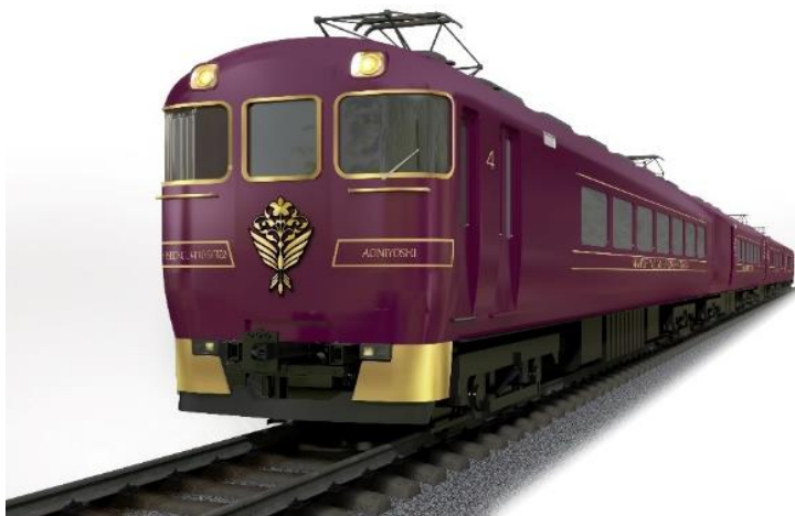
観光特急「あをによし」外観イメージ