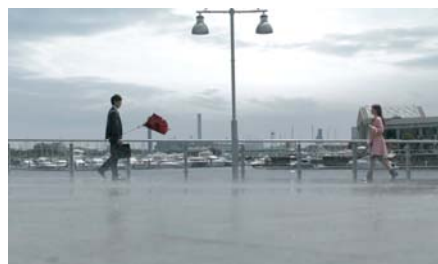
②飛ばされた傘を見事に男性がキャッチ