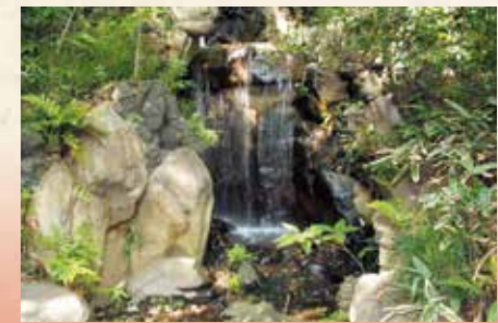
現在も井戸水を水源にしている大滝

十数mの高所から落ちる滝。園内のもっとも勾配の急な所をさらに削って断崖とし、濃い樹林でおおって深山幽谷とした趣があります。曲折した流れから始まり、数段の小滝となり最後は深い滝つぼに落ちるといった凝った造りです。