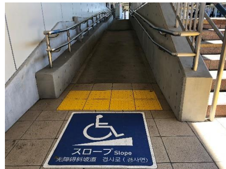
○下りホームスロープ (供用済み)