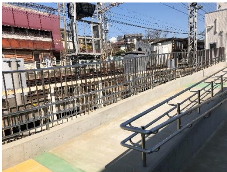
○外部スロープ (2018年3月17日供用開始)