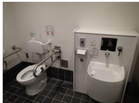
○多機能トイレ (供用済み)