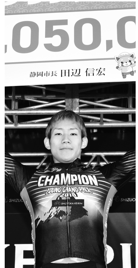
ヤンググランプリ優勝 太田竜馬選手