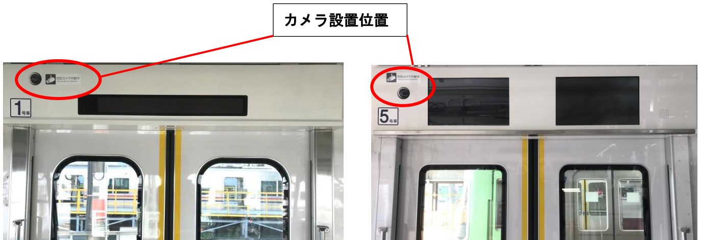
《車内防犯カメラ ㊤京王線8000系 ㊦井の頭線1000系》