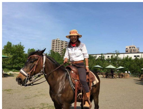
《クォーターホースのマリヤちゃん》