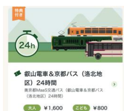
奥京都 MaaS 画面イメージ