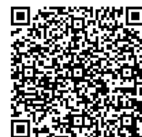
奥京都 MaaS サイト