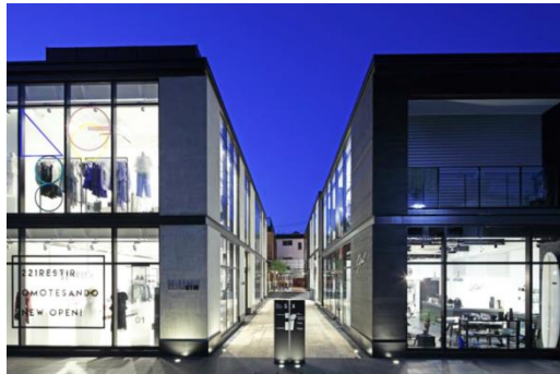
SIX HARAJUKU TERRACE (複合商業施設／東京都渋谷区神宮前)