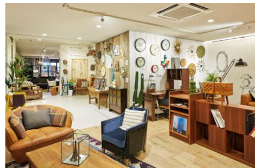
LIVING HOUSE (堀江本店) (インテリアショップ／大阪市西区南堀江)