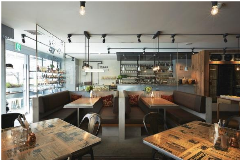
カフェ社が手がけるカフェ 「TABLES Coffee Bakery&Diner」(大阪府西区南堀江)