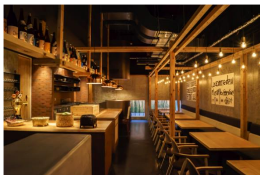
てつ鍋 カツを （鉄鍋料理・地酒／大阪府枚方市岡本町）