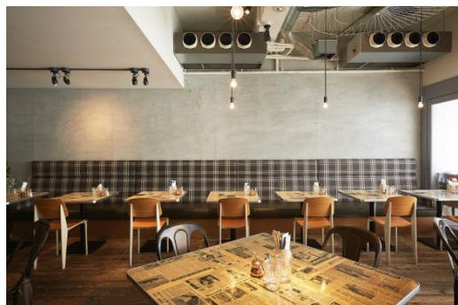
TABLES Coffee Bakery&Diner（カフェ／大阪市西区南堀江）