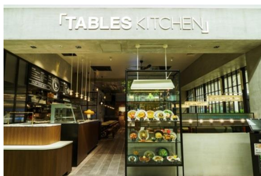
TABLES KITCHEN（カフェ／大阪府吹田市千里万博公園 ららぽーと EXPOCITY）