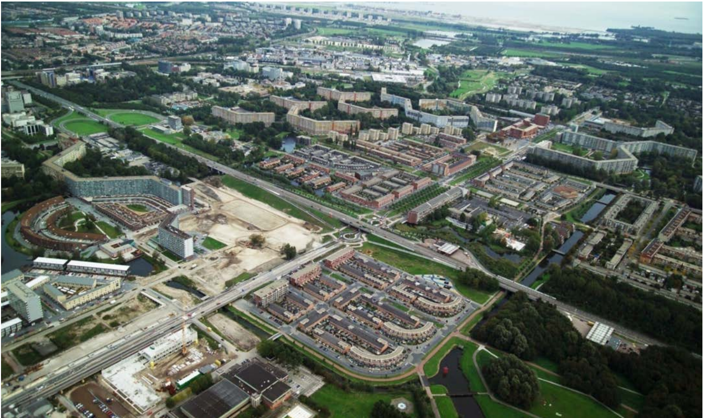
図 1. 再生事業完成のベルマミーア