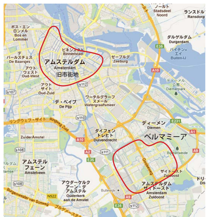
図 2. ベルマミーアの位置

が戻り、治安が改善し、あらゆる分野においてベルマミーア再生の当初の目標は達成されつつあることが明らかになった。