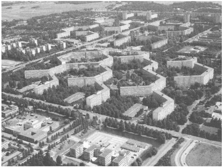
図3. ハネカム住棟が林立する再生前の状況

建設工事は1966年12月に始まり、その2年後から入居が始まった。そして10年の突貫工事で1975年に完成した。ところが入居後しばらくして、この”未来都市”が次第に混乱と荒廃のまちに變貌していった。当初期待された中間層は来住してこなかった。いったん入居した人たちも郊外住宅へ