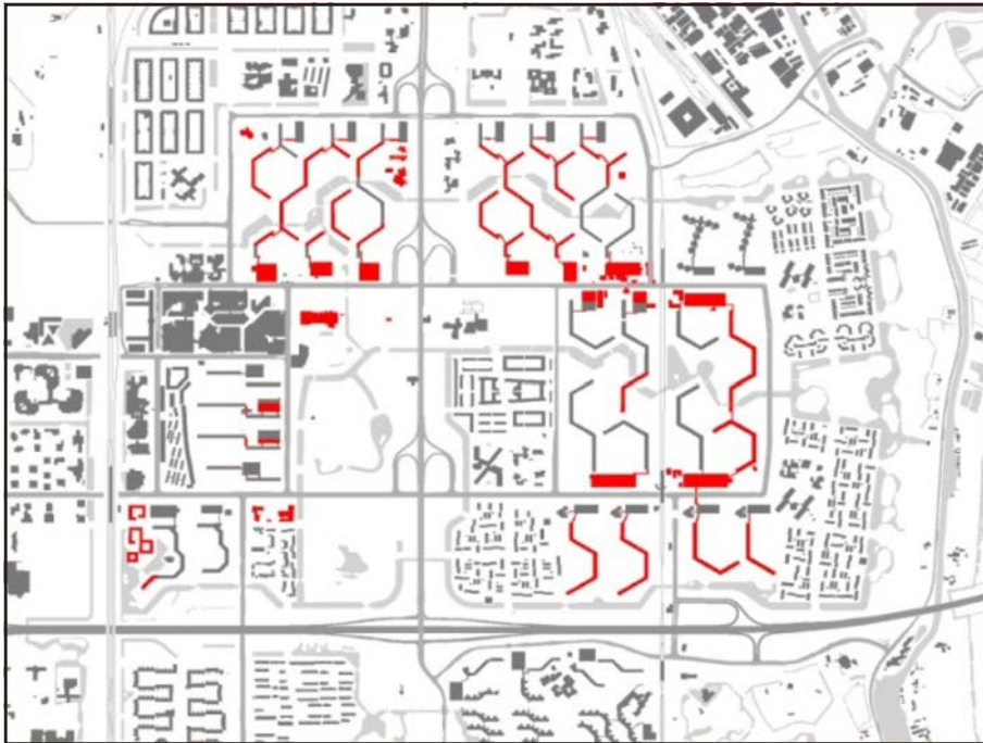
図 4.1992 年のベルマミーア (赤い部分が撤去された)