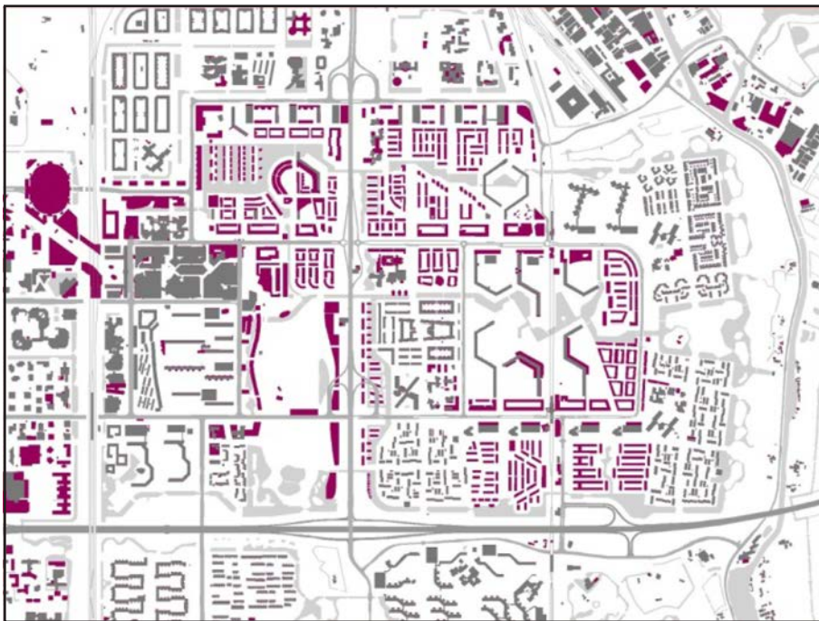
図 5.2012 年の完成予想図 (紫の部分が新築された低層住宅等)

すべての意思決定を住民参加で行い、これらの達成のために柔軟で活力ある住民、行政、企業三者のパートナーシップを確立させることである。