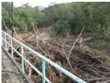
【倒木・電柱折損・電線切断】 函館線 大沼～長万部 約200本の倒木処理中 電線接続中