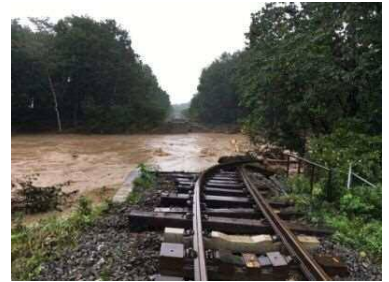
【橋りょう流失】 根室線 新得～十勝清水 第1佐幌川橋りょう