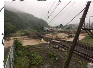
【橋りょう流失・路盤流出】 根室線 新得構内 下新得川橋りょう