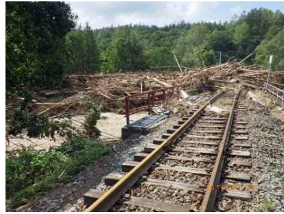
根室線 落合～新得 111k985m付近 第1ルーオマンソラアチ川橋りょう