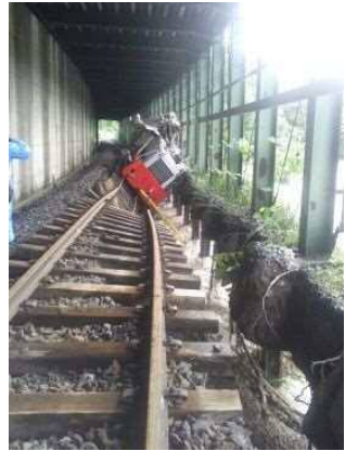
【路盤流出】 石北線 上川～白滝 53k100m付近