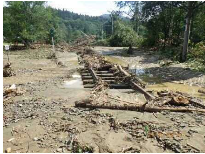
【土砂流入】 根室線 幾寅～新得 108k～113k付近 複数箇所