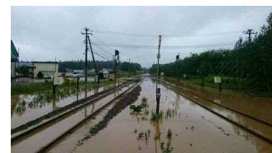
【橋りょう流失】 根室線 十勝清水～羽帯 清水川橋りょう