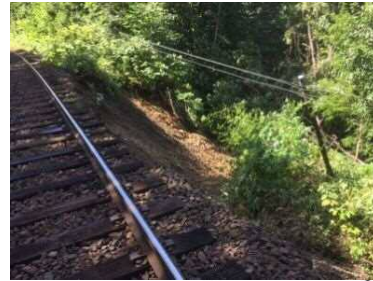
【盛土崩壊】 石北線 上川～白滝 76k690m付近