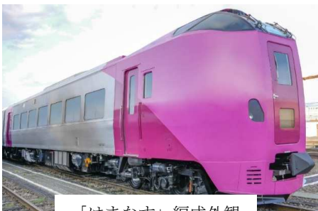
「はまなす」編成外観