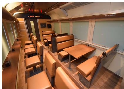
増1号車 自由席 「はまなすラウンジ」