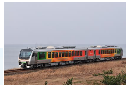
リゾートあすなろ