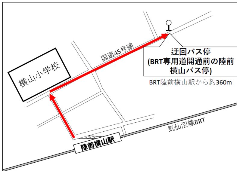
陸前横山駅 迂回バス停位置図