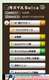
2011 年 7 月 Android スマートフォンで サービス開始