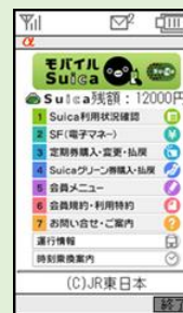
2006 年 1 月 携帯電話でサービス開始