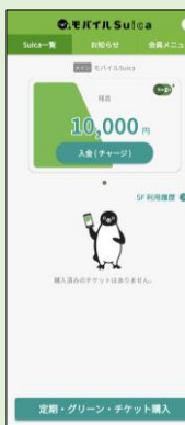
2021 年 3 月 モバイル Suica リニューアル （Android 版）