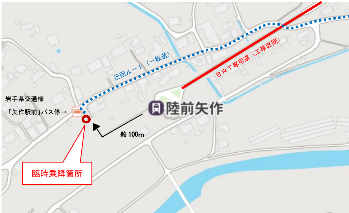
(C) Mapbox (C) OpenStreetMap (C) Yahoo Japan Z17LE 第 1040 号、Z17LE 第 1041 号