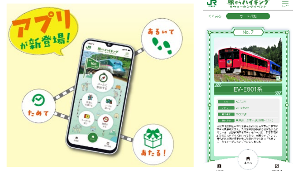
「列車カード」イメージ