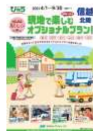
(びゅう旅行商品 パンフレット)

JR 東日本の主な駅にある「びゅうプラザ」にて発売中！ びゅう旅行商品パンフレット名： 「駅たび 現地で楽しむオプションプラン！信越・北陸」