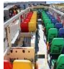
オープントップバス 車内