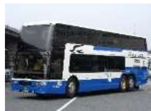
強風等悪天候時、2階建バス(屋根あり)