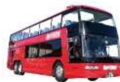
オープントップバス 外観