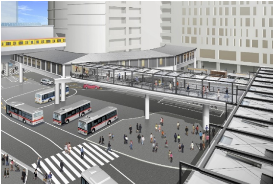
完成イメージ(渋谷クラス側から見る)