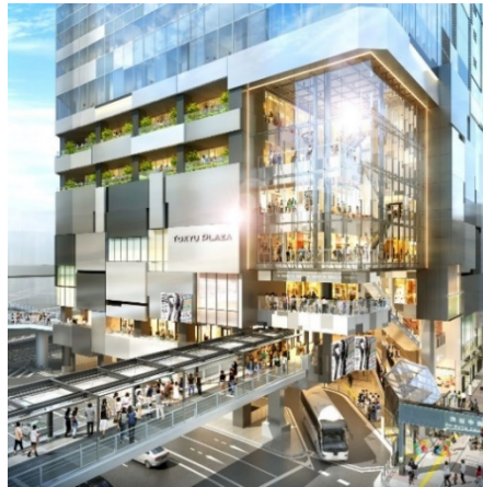
完成イメージ(渋谷クラス側)