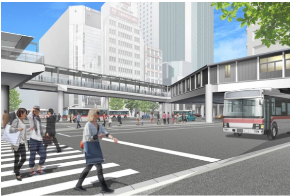
完成イメージ(JR渋谷駅側から見る)