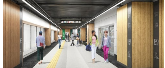
改札内コンコース内観イメージ