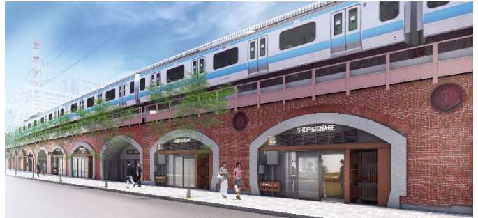
全面開業時駅舎および店舗外観イメージ