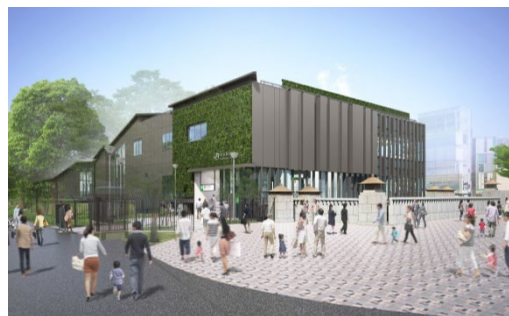
原宿駅新駅舎外観イメージ