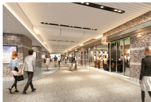
全面開業時改札外コンコース内観イメージ