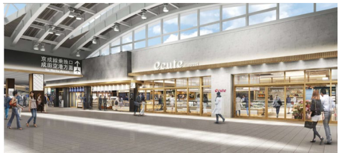
改札内コンコースおよび店舗内観イメージ