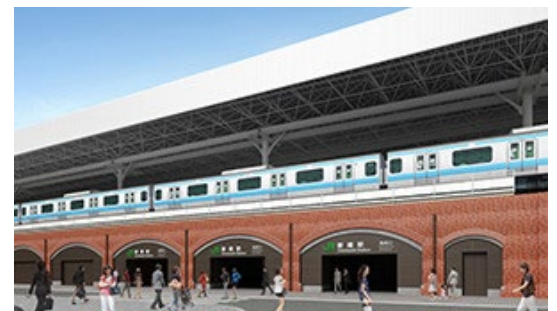
全面開業時駅舎完成イメージ