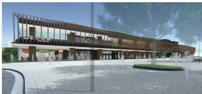
全面開業時新公園口駅舎外観イメージ