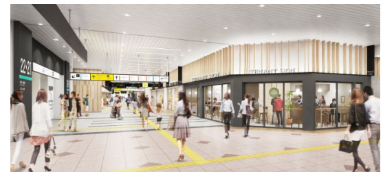
全面開業時改札内コンコース内観イメージ