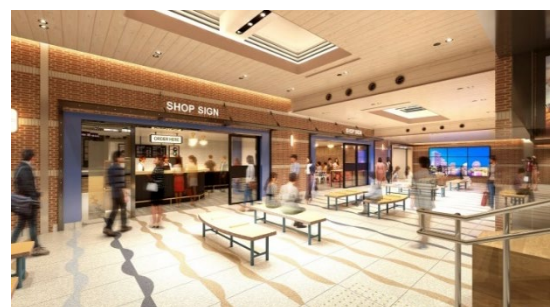
改札内コンコース及び店舗内観イメージ