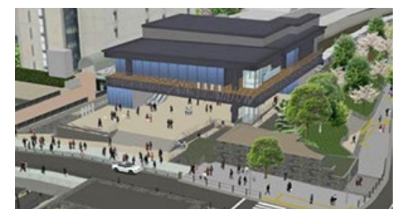
全面開業時西口新駅舎外観イメージ