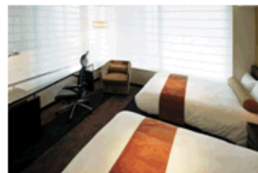
デラックスツインルームイメージ

「サピアタワー」の高層部27階～34階までの8フロア(客室数343室)。ビジネスネットワークをサポートする最新の設備と、ゆったりとくつろげる安らぎの空間を提供いたします。約6割を占めるシングルルームのほか、カップルやご家族でご利用いただけるダブル、ツインルームをはじめ、人に優しく使いやすい設備を備えたユニバーサルルームを6室設けるなど、様々なシーンを想定したフレキシブルな客室構成です。