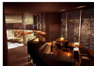
レストラン(27階)イメージ

宿泊客はもちろん、東京駅周辺に勤務するビジネスパーソンに「くつろぎの空間」を提供するレストランは「和」の要素を取り入れたモダンなインテリアデザインによる落ち着いた空間となります。朝食はバラエティに富んだ料理をビュッフェスタイルで。ランチは質の高さを意識した料理をリーズナブルな価格でクイックに。ディナーは和の食材を用いてドリンクとの相性を意識した創作料理を提供いたします。