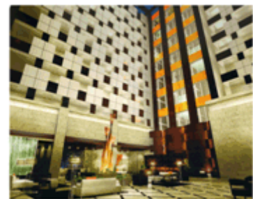
ホテルロビー(27階)イメージ