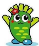
奥多摩町キャラクター わさびー