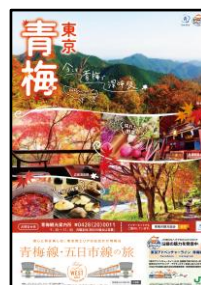
「秋の青梅」ポスター