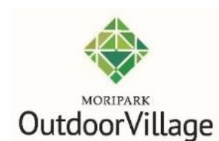
モリパーク アウトドアヴィレッジロゴ