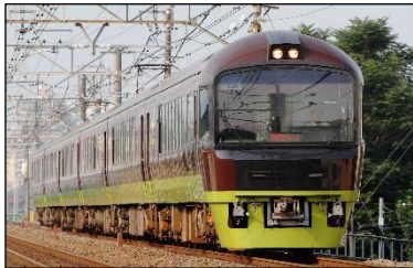
やまどり 青梅奥多摩号 (アドベンチャーライン)

※3 11月1日(日)運行の臨時列車車内では「山のふるさと村」ビジターセンタースタッフによる車内イベントを実施します。