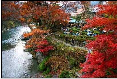
【御嶺コース】御岳遊歩道