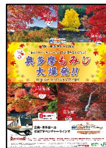
「奥多摩もみじ大爆発」ポスター