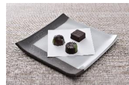
お菓子工房ルミエール わさびチョコレート