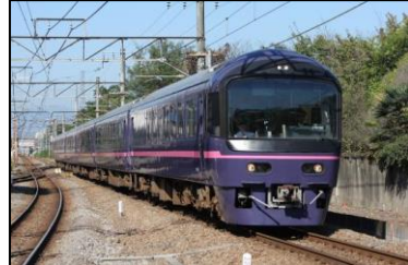
お座敷 青梅奥多摩号