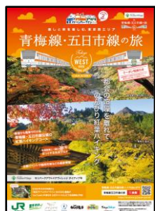
「青梅線・五日市線の旅」冊子

内 容：ぬり絵（青梅駅に掲示予定）、運転台シミュレータ体験・ドア閉め体験等のイベント、沿線の観光PR