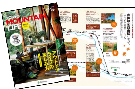
「TOKYO MOUNTAIN LIFE」冊子