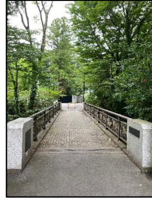
【福生コース】加美上水橋（支線廃線跡）