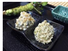
奥多摩 山城屋 本わさび漬け 数の子わさび漬け