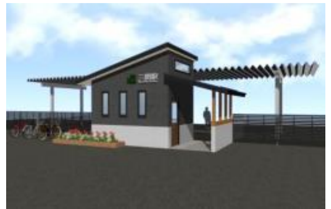
【新駅舎 完成イメージ】