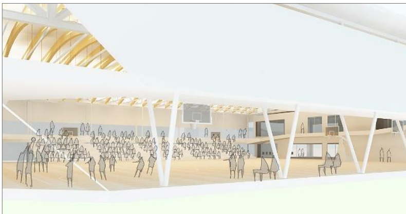
大会時の活用イメージ（1面利用）