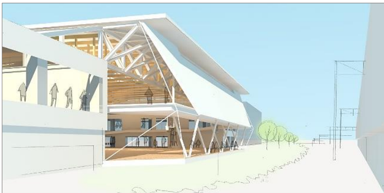
秋田新幹線こまちからの眺め