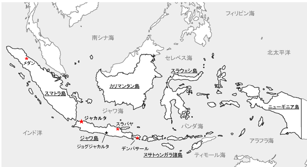
図表 1-2 インドネシア全図

スマトラ、ジャワ、カリマンタン、スラウェシ、ニューギニアの 5 つの大きな島とその他の多くの群島から成り立っている。このため、広大な領域の国土を有しているにも拘らず、陸上で国境線を接しているのは、東ティモール（ティモール島）、マレーシア（カリマンタン島）、パプアニューギニア（ニューギニア島）の 3 国に過ぎない。なお、海を隔てて近接する国としてはフィリピン、シンガポール、マレーシア、オーストラリア、パラオなどがある。