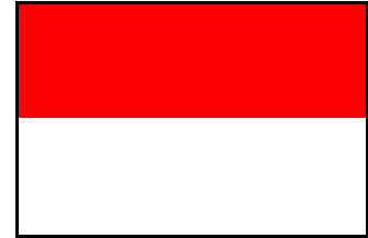
インドネシアの国旗

白色は潔白を、赤色は勇気を表し、この2色の組み合わせで潔白の上に立つ勇気という意味を持つ。また、同時に赤と白は、太陽と月を表している。配色はモナコ国旗と同じだが、インドネシア国旗は縦横比が2対3（モナコ国旗は4対5）である。ポーランド国旗とも似ているが、ポーランド国旗は上が白、下が赤である。