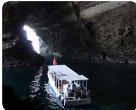
加賀の潜戸(島根町)

美保神社から車で数分走りますと、島根半島の先端にたどり着き、美保関灯台を見ることができます。灯台の高さは14mと大きくありませんが「世界の歴史的灯台100選」「恋する灯台プロジェクト」に選ばれています。