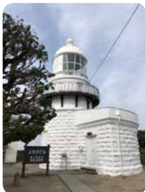
美保関灯台(美保関町)

美保関町といえば、美保神社、美保関灯台です。美保神社は、えびす様の総本宮として有名ですが、音楽の神様としても知られており、近年ではアーティストを招いた音楽祭も行われています。