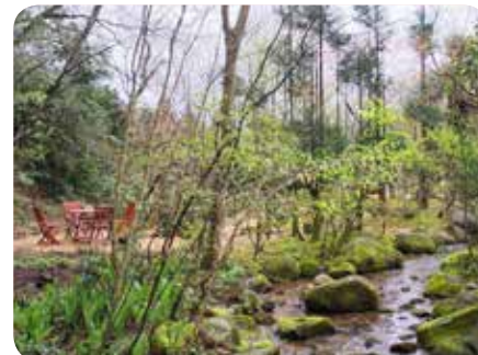
いやしの森(鹿島町)

に向かう訳ですが、その途中にある佐太神社(さだじんじゃ)にもお立ち寄りになられ、大祭がとり行われます。佐太神社で行う佐陀神能(さだしのう)は、ユネスコの無形文化財にも登録されています。