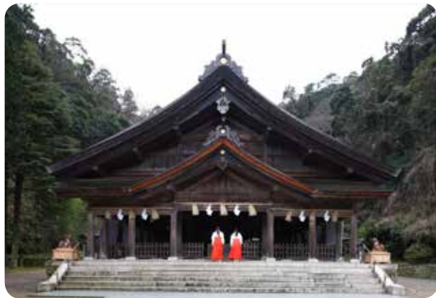
美保神社(美保関町)

今回は、素朴な漁村風景と豊かな自然に囲まれた景勝地である島根半島を紹介させていただきます。