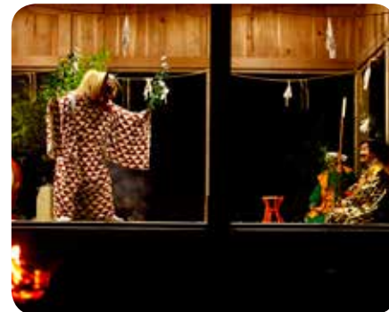
佐陀神能(鹿島町)