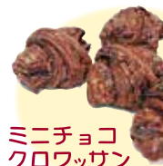
ミニチョコクロワッサン