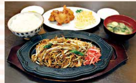
焼きそば・ご飯・味噌汁・唐揚げ3個がついた「唐揚げランチ」(1,200円)

オープンして2年4か月の「焼きそば 優心」。日田焼きそばの元祖として知られる「想夫恋」(そうふれん)で12年間焼きそばを作り続けてきた店主が腕を振ります。