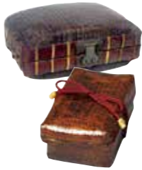
江戸時代の弁当箱

売って歩く「卵売り」がいました。この頃すでに料理本が多数出版されており、卵を使う料理は数百点も紹介されていました。その中で、掲載数1位に輝いたのは「玉子ふわふわ」。この料理は、卵を溶き、だし汁を加えて煮たもので、「東海道中膝栗毛」の中では、食事のワンシーンとして登場しているそうです。「いりたまご風」や「かき玉風」など仕上がりは様々で、幅広かったようです。