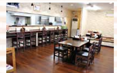
店内は広々としており、カウンターとテーブル4人席の他、掘りごたつの4人席もあります。