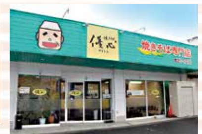
県道401号線沿い、店主の似顔絵が描かれた緑の屋根が目印です。