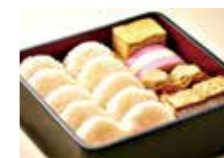
江戸時代の幕の内弁当

「幕の内」とは、江戸時代の芝居見物から出た言葉で、舞台の幕が下り、次の幕が上がらるまでのことを言います。その間に観客(または役者)が食べる弁当という意味で「幕の内弁当」と言われるようになりました。 現在では、ご飯は俵型のおにぎりに黒胡麻を散らし、梅干しをのせたものが基本です。