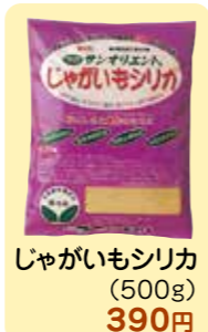
じゃがいもシリカ (500g) 390円

グリーンセンター各店舗で日頃の感謝を込めて、 3月4日(土)〜5日(日)に春の感謝セールを開催します。 皆さま方のお越しをお待ちしています。