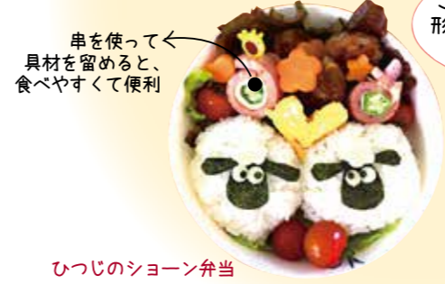
ひつじのショーン弁当 オニギリと海苔のひつじのショーンがかわいいですネ。