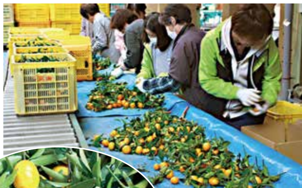
ひとつひとつ丁寧に選果して箱詰め