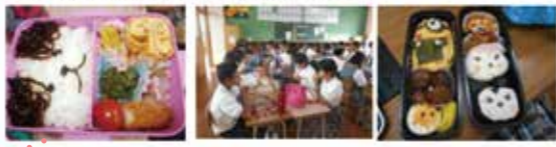
▲「中央中学校だより」(平成28年6月号)より

昨年度に続き、体育祭あけの5月24日(火)に「弁当の日」を全校一斉に実施しました。「何か1品でも自分でお弁当を作ってみよう」という食育の取組の一環です。早起きして作る大変さや、おかずを自分で作ることの難しさを知って、土日の部活動などでお弁当を作ってくれる家族の方に感謝したり、家で手伝いをしようという気持ちになったりと、いい機会になったようです。「自分の食べるものを自分で作る」というのは、これから生きていく上で、最も大切なことです。家庭でも、子どもに任せる日や手伝いの日等を試みられてはいかがでしょうか。