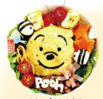
くまのプーさん弁当 オムライスにプーさんの顔にしました。 ウズラの卵のミツパチもいます。