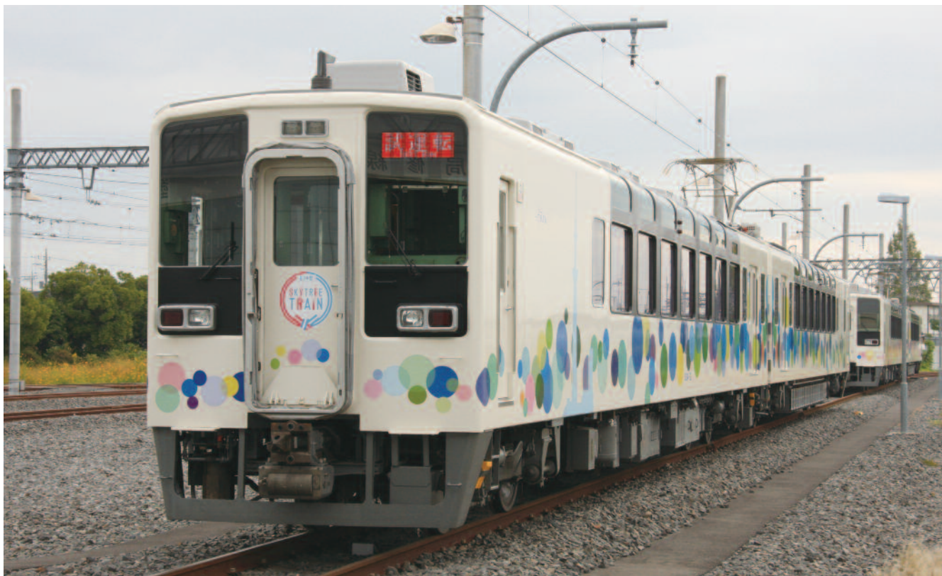
図1 634型 外観