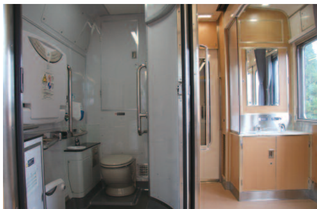
図4 車いす対応トイレと洗面所