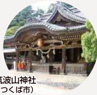
筑波山神社 (つくば市)

地図上のこちらのマークは パンフレットの中で 作品紹介をしている ロケ地のおおまかな 位置を示しています。