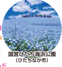
国営ひたち海浜公園 (ひたちなか市)