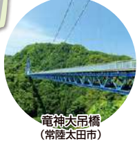
電神大吊橋 (常陸太田市)