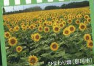
ひまわり畑 (那珂市)