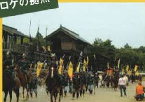
▲NHK大河ドラマ「功名が辻」の撮影風景