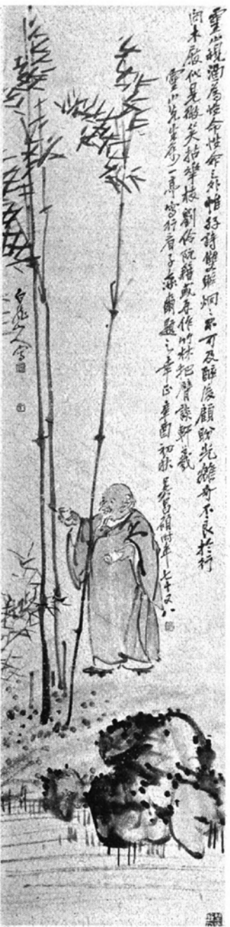
詩題氏顧昌吳 筆氏亭一王